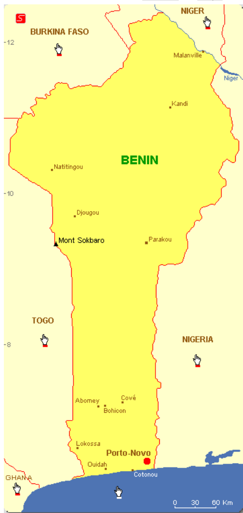
Carte du Bénin