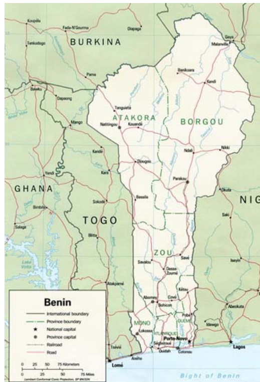
Carte du Bénin